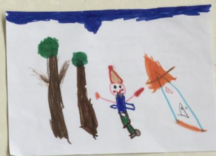
Alberi che si abbracciano e lo gnomino si spaventa.