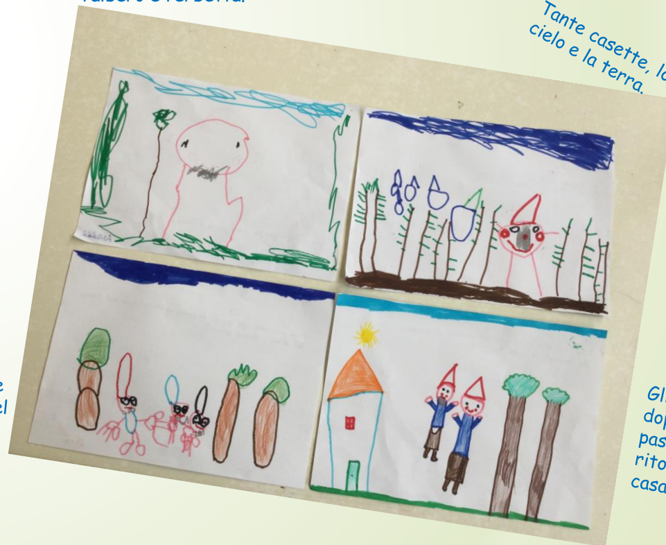
Gli gnomi dopo passeggiata ritornano a casa.