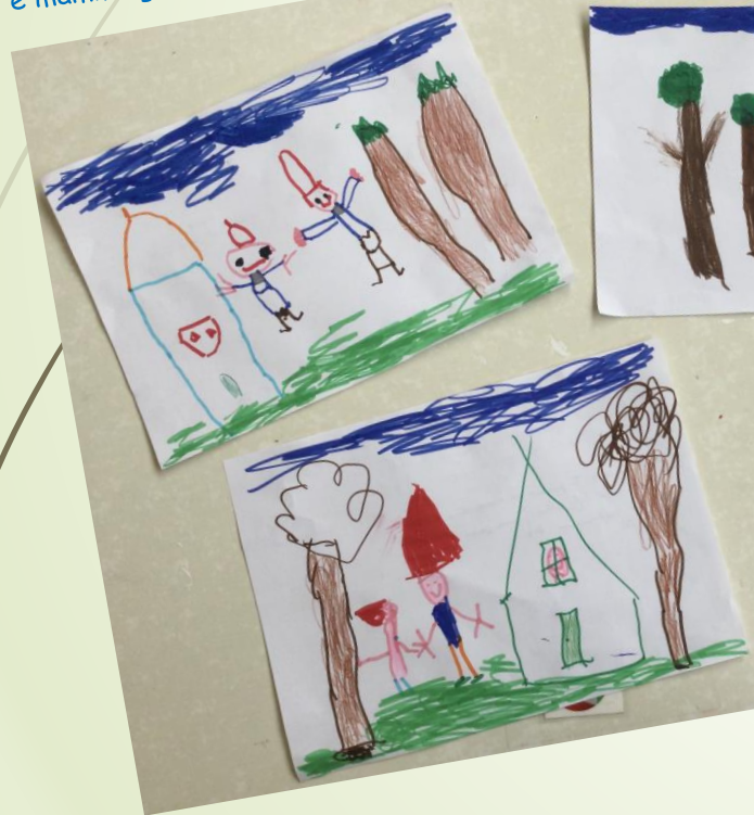
La casa degli gnomi, papà e mamma gnomino saltano